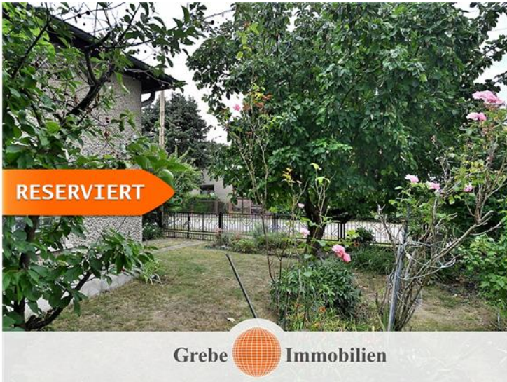
Baugrundstück in Karow